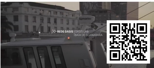
Oásis Lab Baía de Guanabara. Clique e assista ao vídeo.