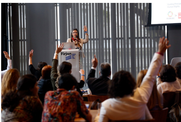
Workshop Critérios de Sustentabilidade na Cadeia de Valor reuniu mais de 80 participantes em 2019 na Casa Firjan.