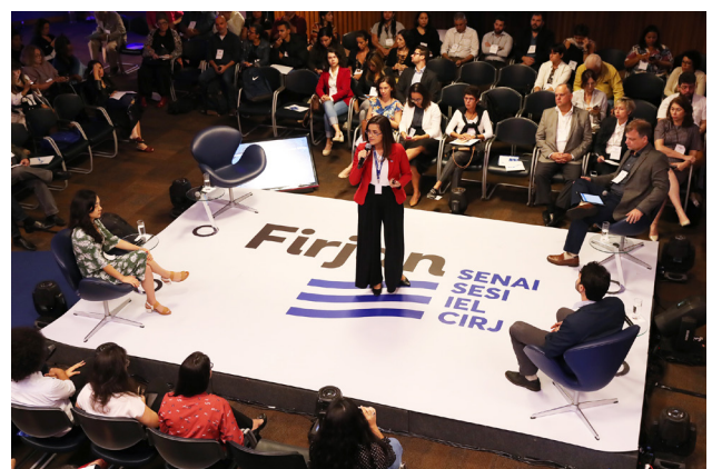
Ação Ambiental 2019 pautou soluções sustentáveis para a Baía de Guanabara a partir dos ODS.