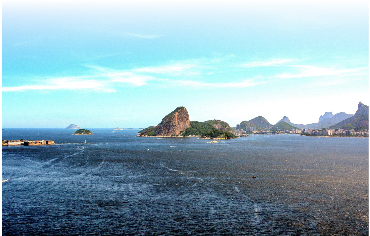
Baía de Guanabara.