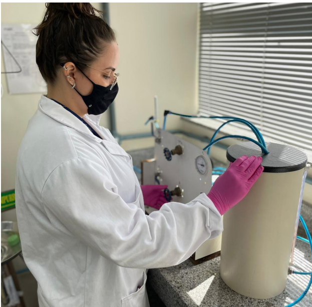
Técnica trabalha no projeto de ultrafiltração para purificação de água.