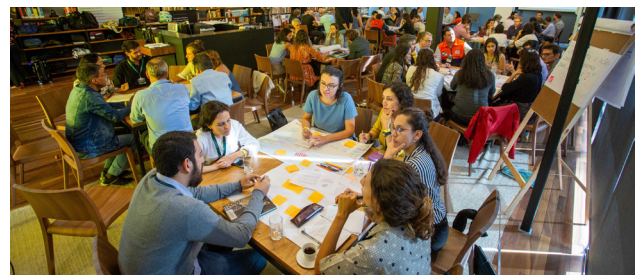
Workshop do Oásis Lab para cocriação de soluções baseadas na natureza, realizado em 2019 na Casa Firjan.