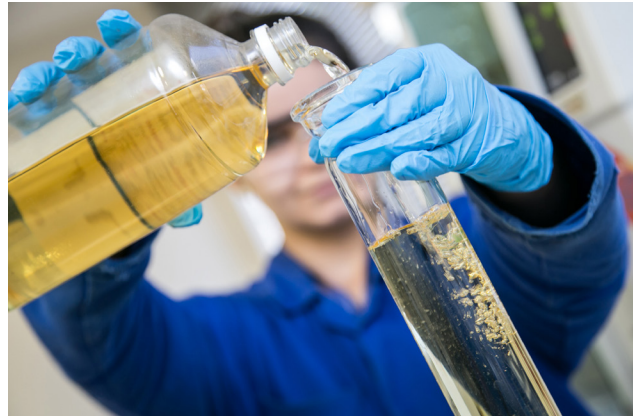
Etapa de desenvolvimento do sistema de filtração à base de material renovável para tratamento de águas oleosas.