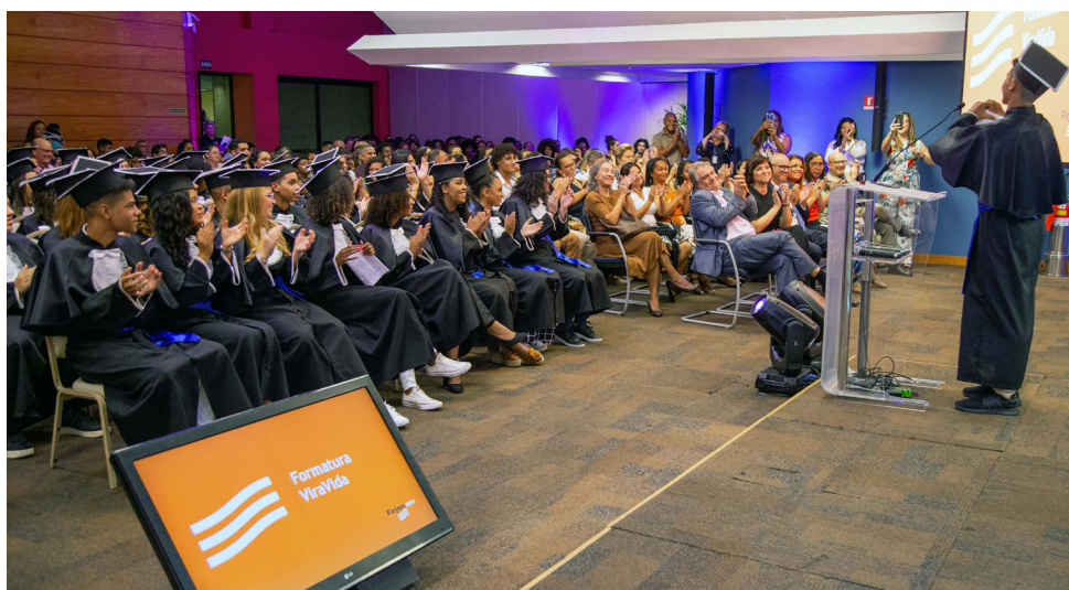
Formatura turma de 2019 do Programa Vira Vida, na sede da Firjan.