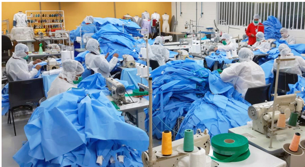
Firjan apoiou empresas para exponenciar fornecimento de itens hospitalares para combate à pandemia.