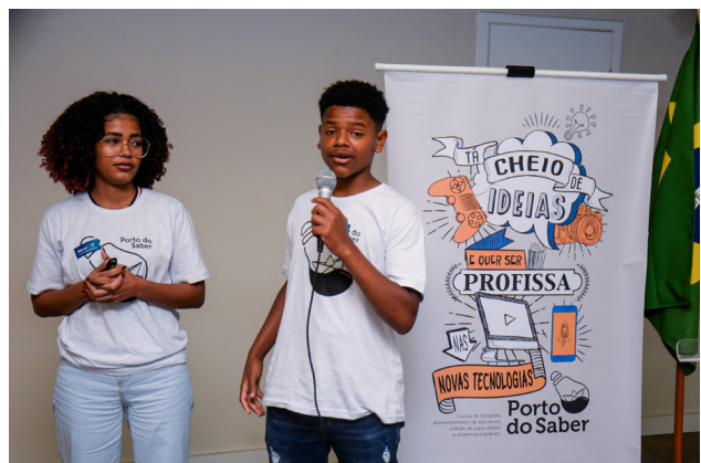
Projeto Porto do Saber, na região portuária do Rio de Janeiro, ofereceu a jovens formações gratuitas ligadas à indústria criativa