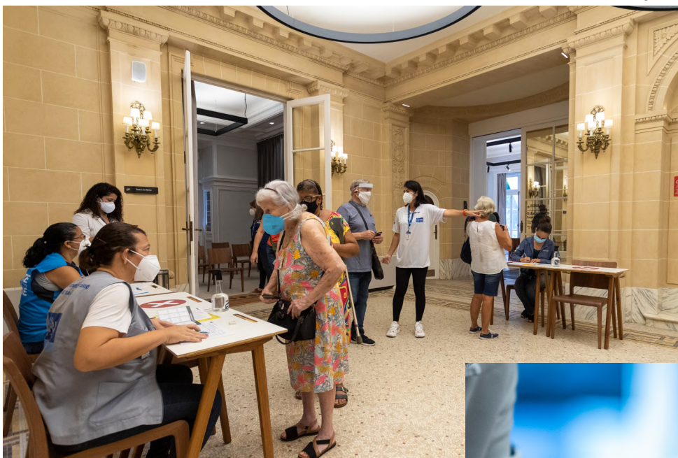
Casa Firjan sediou posto de vacinação, que aplicou 140 mil doses contra a Covid-19