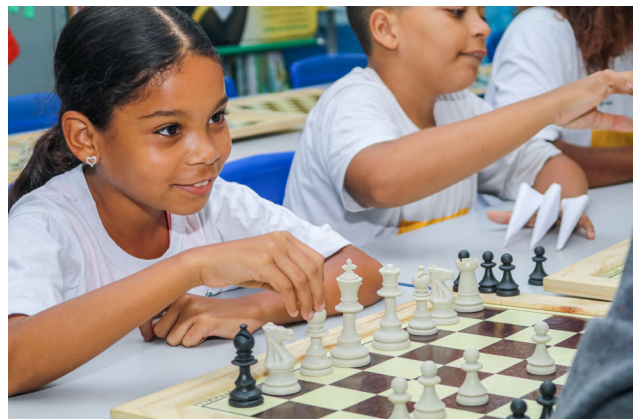
Torneio integrador de xadrez realizado pelo Projeto Centro Esporte e Educação Rio de Janeiro, em Itaboraí