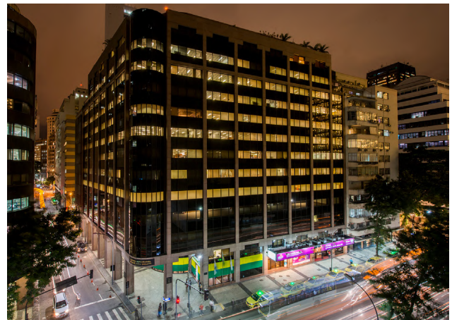
Sede da Firjan

Reunimos em um só lugar todo o apoio, incentivo, informações e soluções para estimular o desenvolvimento da indústria. Portanto, seja qual for o desafio, as empresas podem contar com a parceria integral da Firjan. E a sociedade, com o nosso compromisso de transformar o estado do Rio de Janeiro.