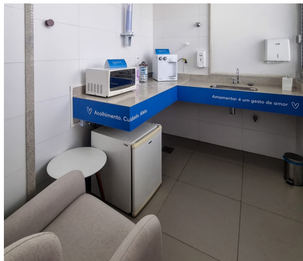
Um dos espa os de apoio ao aleitamento materno dedicado  s colaboradoras lactantes