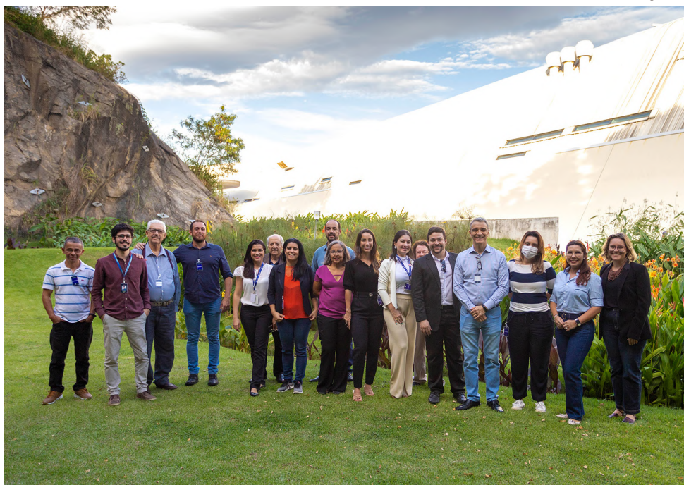
Conselho de Meio Ambiente em visita técnica a centro de pesquisa industrial, com jardins filtrantes, no Rio de Janeiro