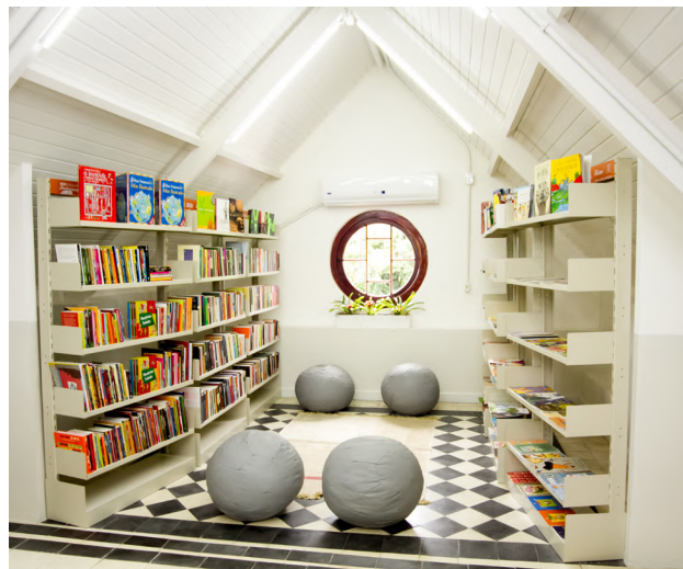
Indústria do Conhecimento, no Morro dos Prazeres, no Rio de Janeiro

ensino que, em razão da pandemia, apresentaram quadro de evasão e defasagem escolar. Foram 1,3 mil visitas e contatos com alunos(as) que estavam na abrangência do Programa SESI Cidadania.