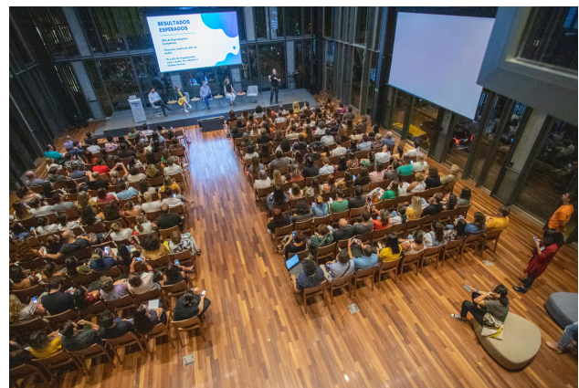
Auditório da Casa Firjan recebe as palestras do Aquário, sensibilizando os participantes para temas relacionados aos princípios do Pacto Global