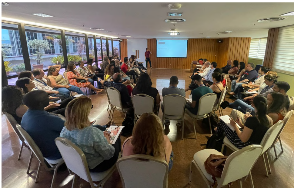
Profissionais de RH da Firjan participaram de letramento em diversidade, equidade e inclusão