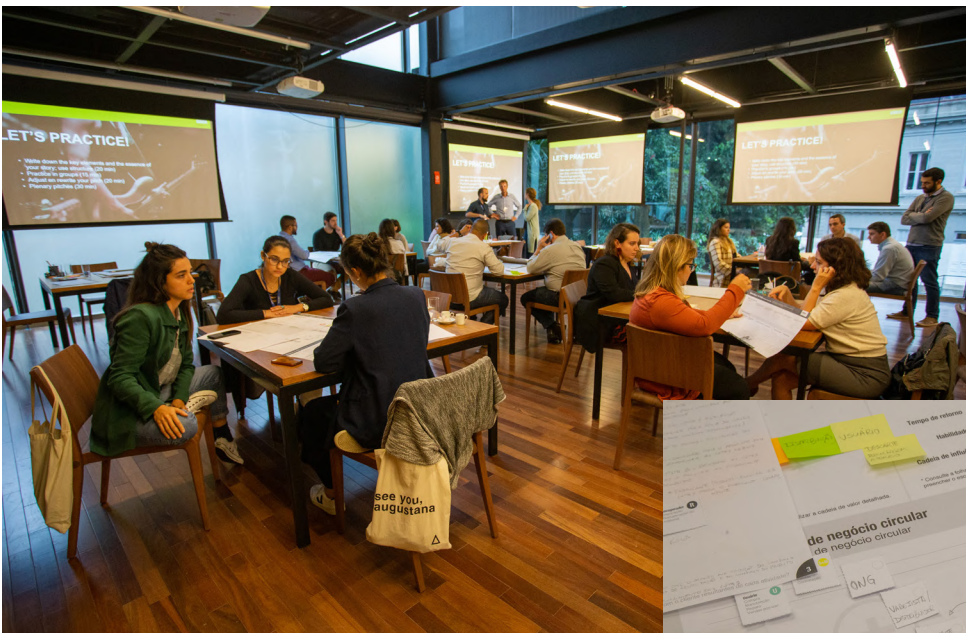
Uma das Trilhas sobre design circular realizadas na Casa Firjan.