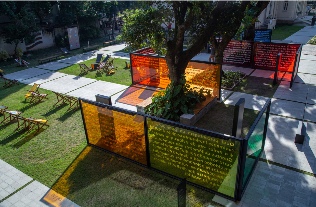
Inaugurada em 2018, a Casa Firjan é um hub de inovação e pensamento no Rio de Janeiro

A sustentabilidade é uma das pautas priorizadas pela Casa desde sua inauguração. No biênio 2021-2022 foram oferecidas diversas ações para diferentes públicos, com os seguintes destaques: