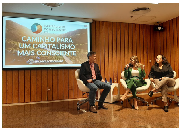
Conselho de Responsabilidade Social debate o tema Capitalismo Consciente