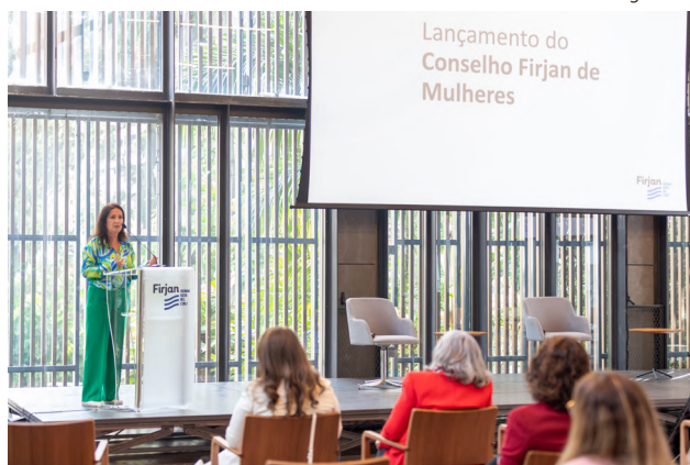
Conselho Firjan de Mulheres iniciou suas atividades em 2022

sociedade, a Firjan lançou em junho de 2022 o Conselho Firjan de Mulheres. O objetivo é ser um ambiente gerador de ações de estímulo ao empreendedorismo e empoderamento econômico feminino e à equidade de gênero na liderança dos diversos fóruns de tomada de decisão no Rio e no Brasil. Conta com mais de 20 integrantes, entre empresárias, líderes sindicais e especialistas de instituições diversas.