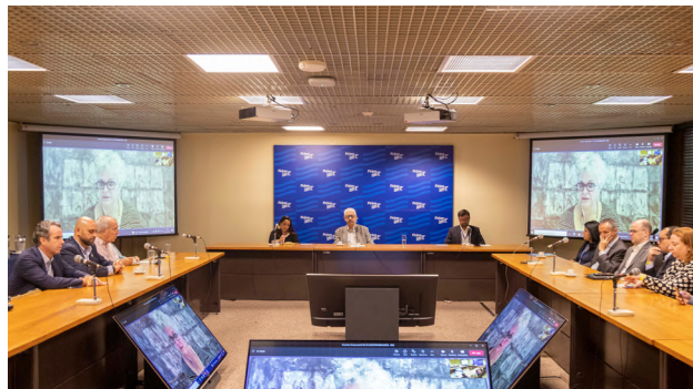
Encontro empresarial levou propostas de políticas públicas de sustentabilidade para os governos eleitos em 2022

encontro empresarial com os governos eleitos para reforço e discussão dos pleitos e estratégias para sua operacionalização.