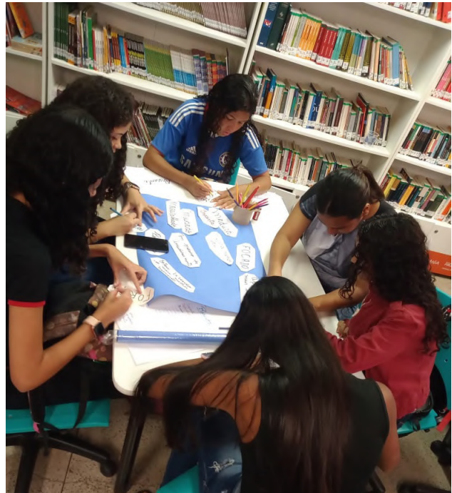
Atividade em grupo no Programa ViraVida, que voltou a acontecer no formato presencial em 2022

do Conhecimento no Morro de Santa Marta, com 884 atendimentos a jovens provenientes do morro Santa Marta, Irajá, Catete, Tabajaras e Rocinha.