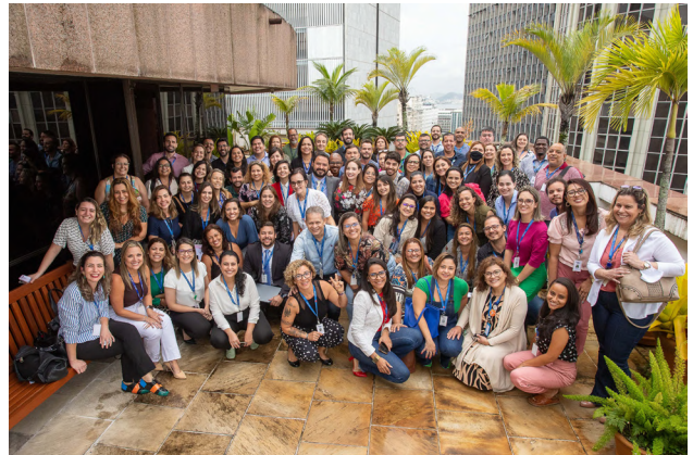
Guardiões da Integridade em reunião de integração na Sede da Firjan

Firjan em temáticas de sua atuação, como a área de saúde.