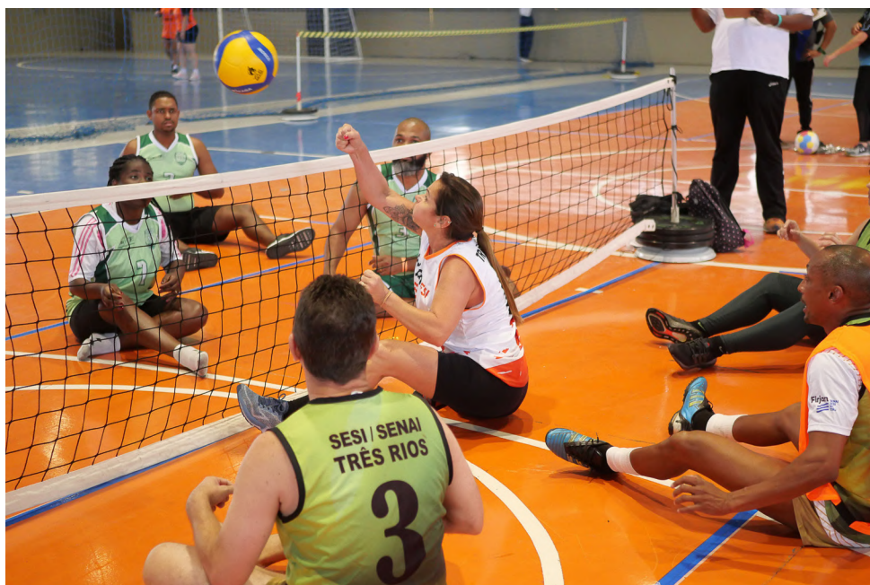
Parte do Programa de Acolhimento Integral, o evento de jogos internos apresentou aos(as) colaboradores(as) modalidades esportivas inclusivas, como o v lei sentado