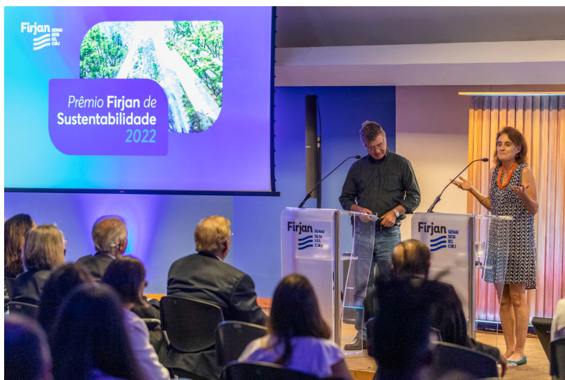
Gestores da Reserva Ecológica de Guapiaçu palestram para as empresas vencedoras do Prêmio Firjan de Sustentabilidade 2022