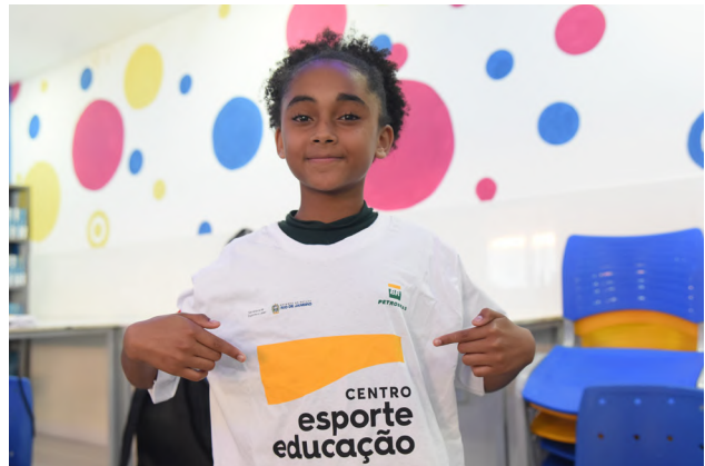
Estudante participa de atividade sobre desenvolvimento humano no Projeto Centro Esporte e Educação Rio de Janeiro, em Duque de Caxias