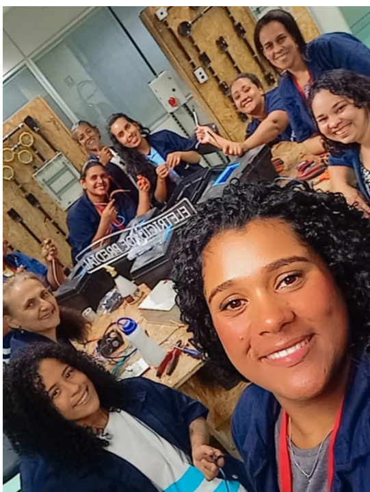
Uma das turmas de Eletricista Predial para mulheres, realizadas pelo SESI Cidadania na Firjan SENAI Jacarepaguá

Outra vertente importante para o Programa foram as parcerias firmadas através de convênios. Em 2021, contribuimos com a Secretaria de Estado de Educação para busca ativa de estudantes da rede estadual de